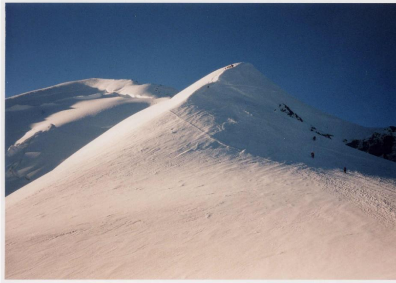
8月15日 モンブラン ヴァロ避難小屋より