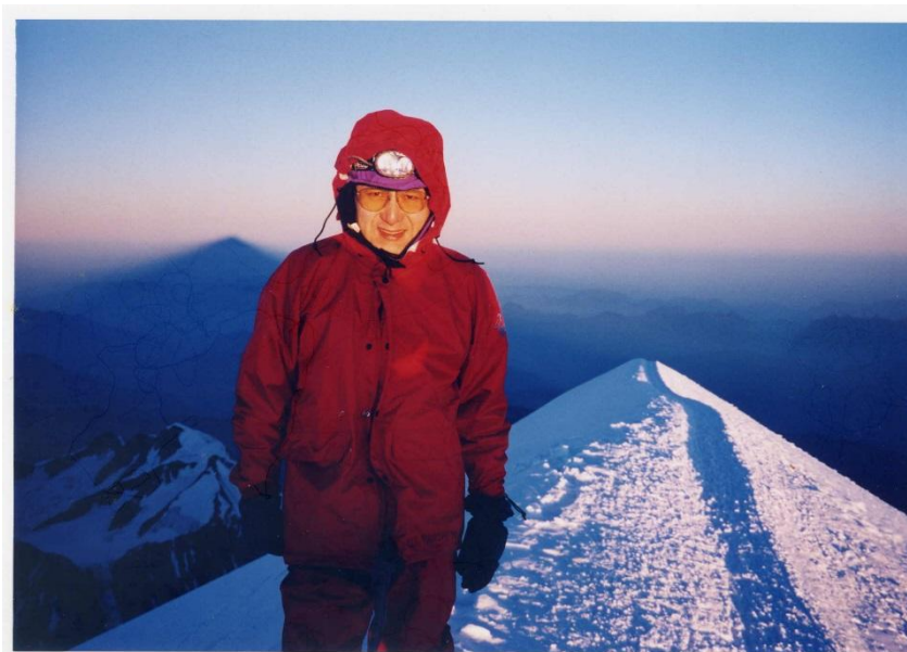
モンブラン（4810m）頂上にて、1997年8月15日