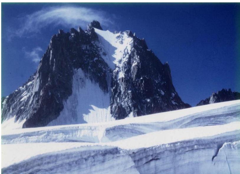
ヴァレ・ブランシュ氷河より