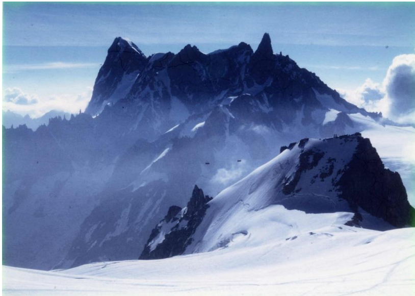
8月13日 ヴァレ・ブランシュ氷河より