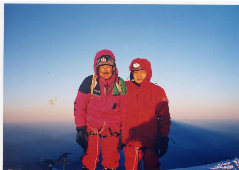
モンブラン頂上にて ジョマリー、福島