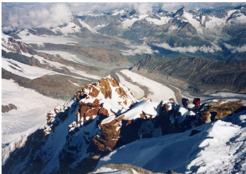
8月15日 モンテローザ頂上からの展望 右回り ① 前衛峰4600m