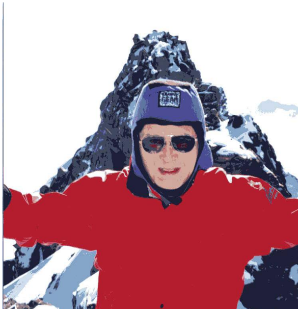
8月15日 モンテローザ頂上（4634m）にて