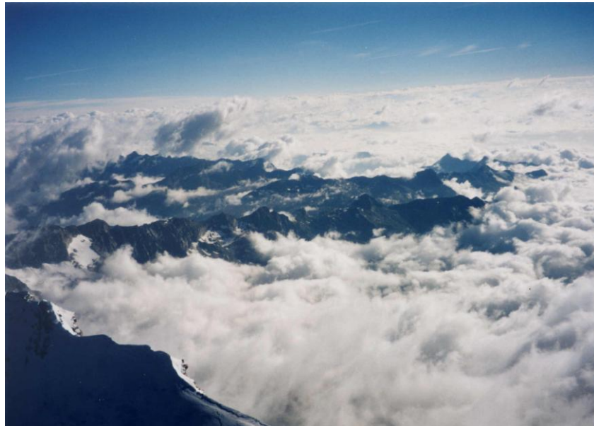
⑤ イタリア側は、壁で切れ落ちている