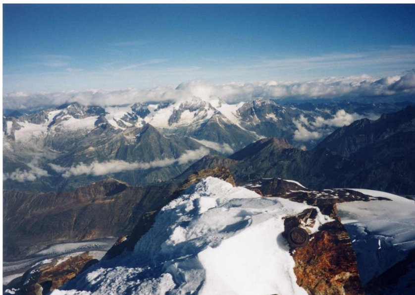
② モンテローザ頂上 4634m