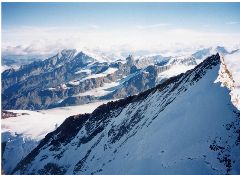
③ ノルトエント 4609m