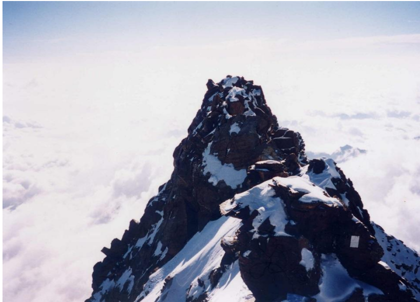
④ グランツギプフェル 4618m