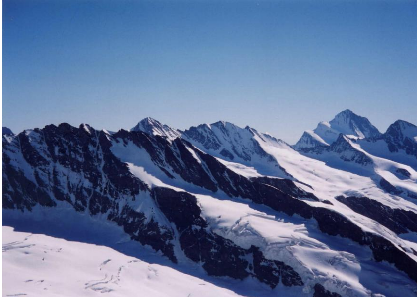
フィンスターアールホルン 4 2 7 3 m