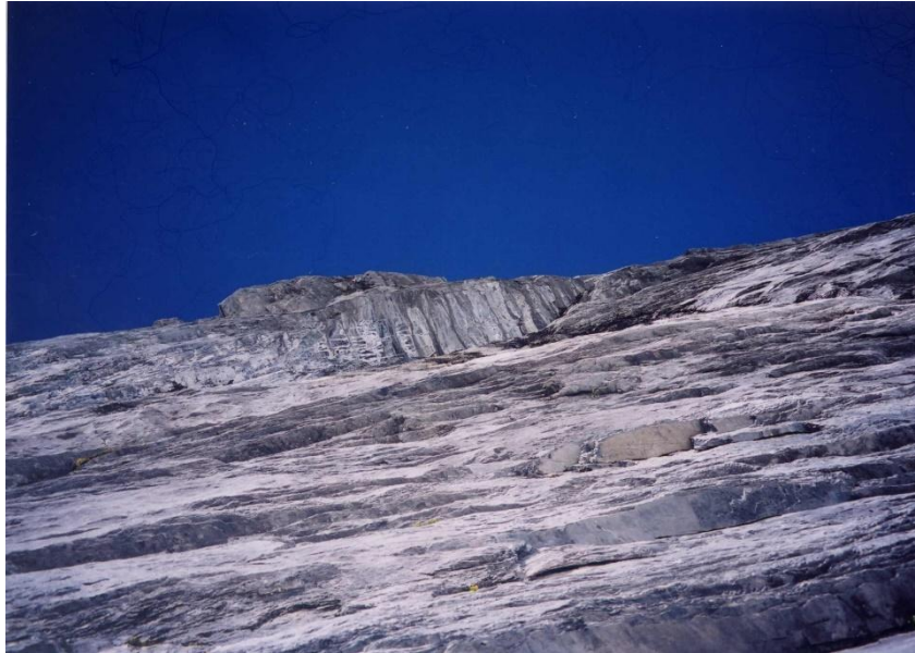
8月17日 アイスメイヤーの岩壁