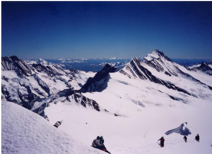
⑦ フィンスターアールホルン 4 2 7 3 m 展望おわり