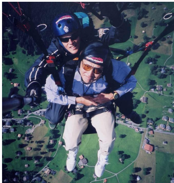
グリンデルワルド上空 パラグライダーから写す