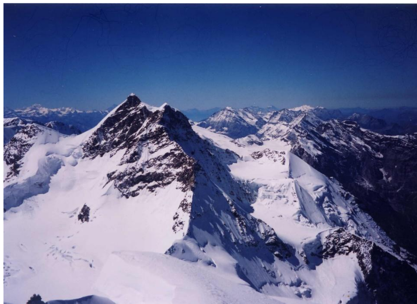
8月14日 メンヒ (4099m) 頂上からの展望 左回り ① ユングフラウ