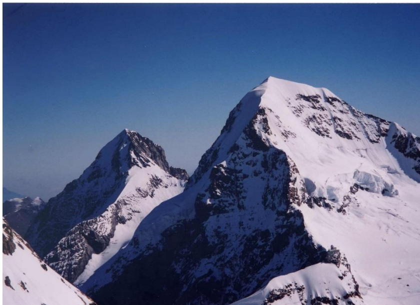
ユングフラウ (4 1 5 8 m) 頂上より 左より アイガー、メンヒ