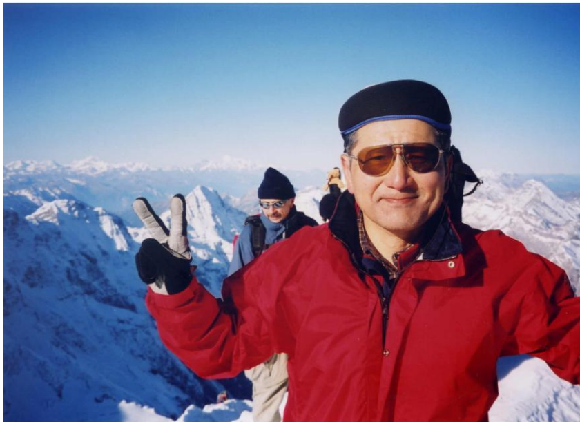
8月15日 ユングフラウ頂上にて