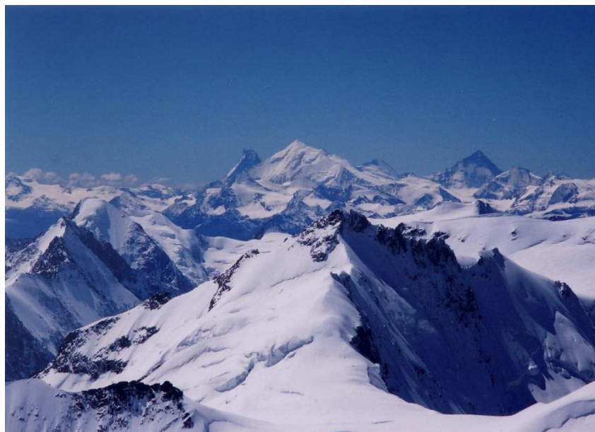
② 左から マッターホルン4478m、ヴァイスホルン4505m、ダンブランシュ4356 m