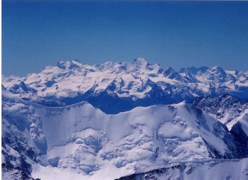
③ 左から モンテローザ4634m、リスカム4527m