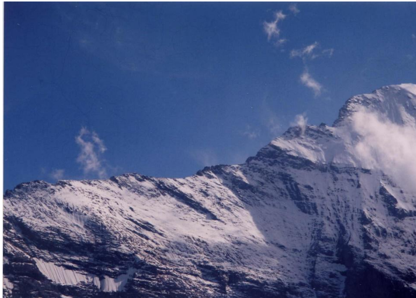
8月18日 アイガー東山稜とミッテルレギ小屋 パラグライダーから写す