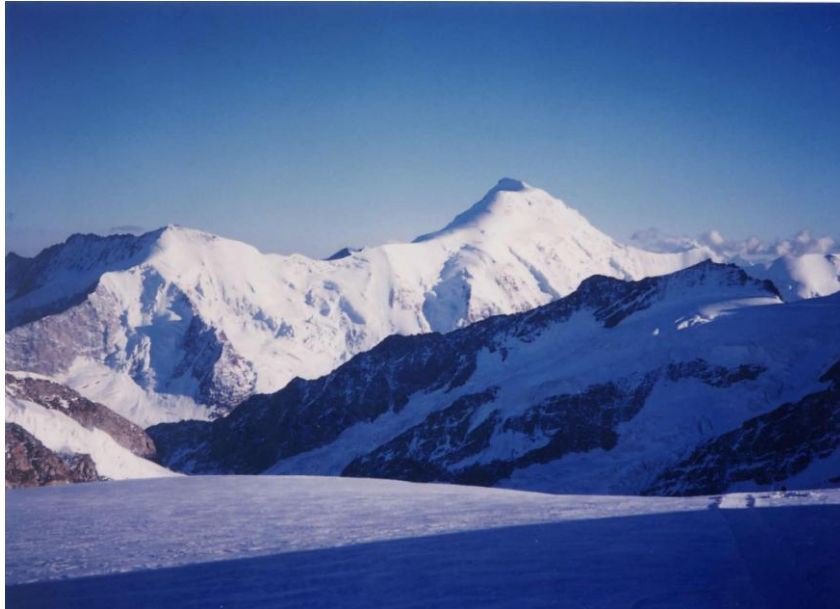
④ アレッチホルン 4195m