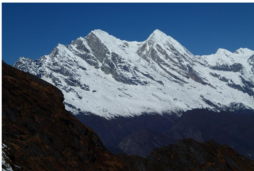
ザトルワラ峠からの眺め (左から)、ヌンプルル6957m