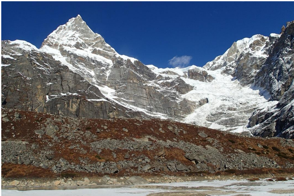
キャシヤール、カンテガ6779m