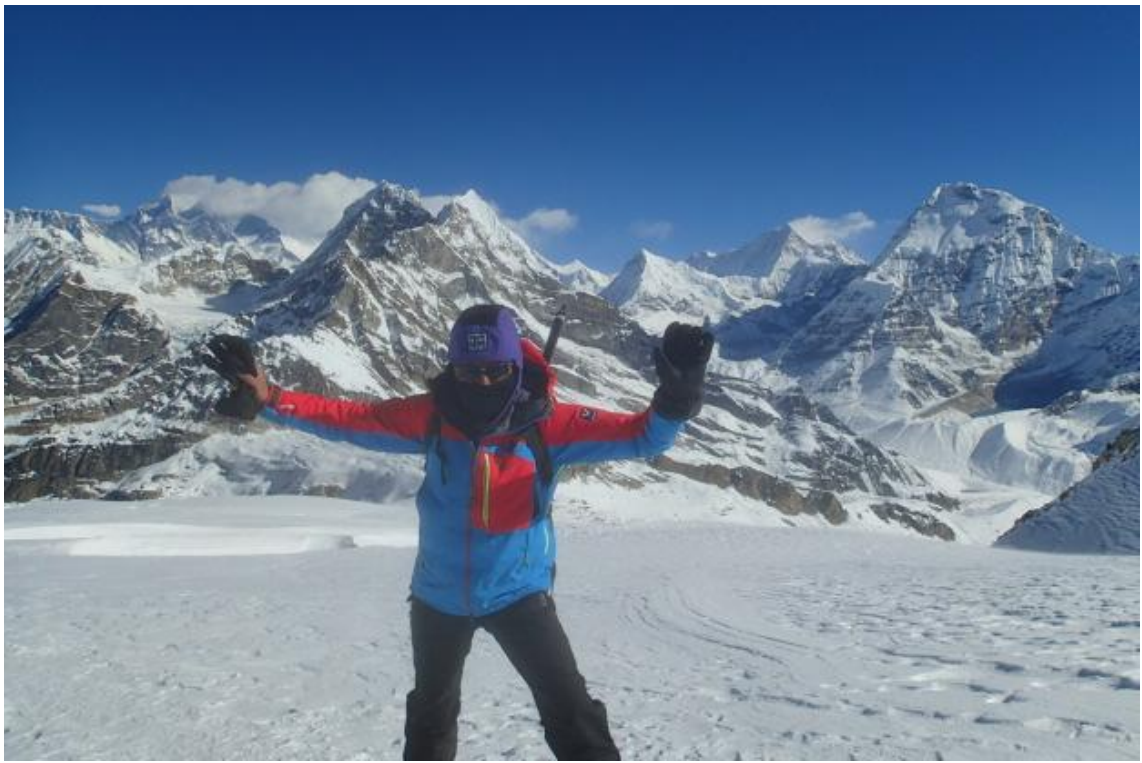
左から、エベレスト、ローツェ、ピーク41、マカルー、チャムラン 2013年11月1日