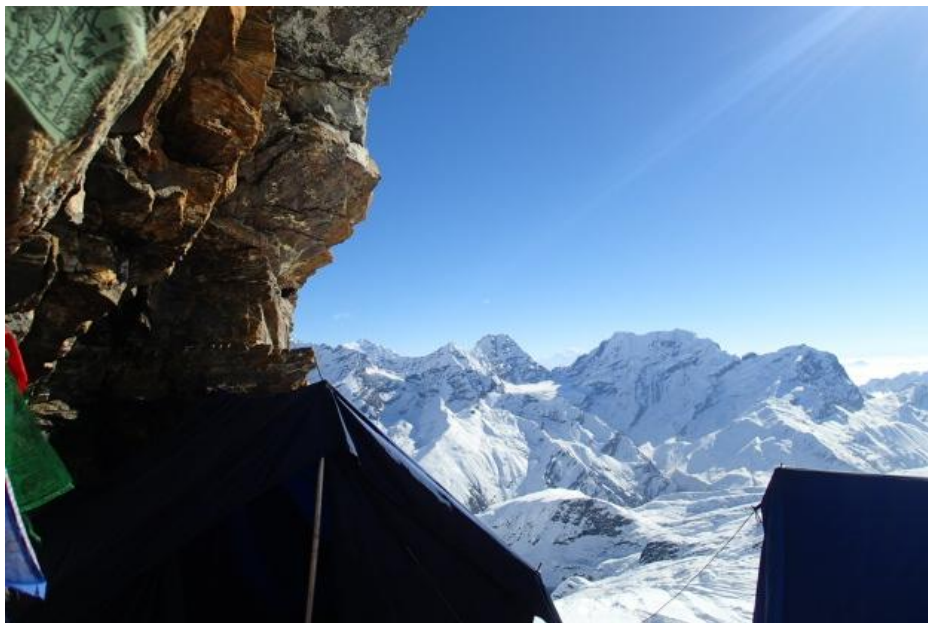
ハイキャンプ 5 8 0 0 m から、マカルー 8 4 6 3 m (左,) チャムラン 7 3 1 9 m (右)