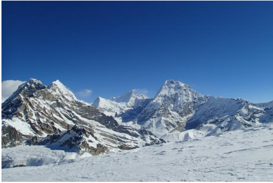
左から、ピーク41、バルンツェ、マカルー、チャムラン