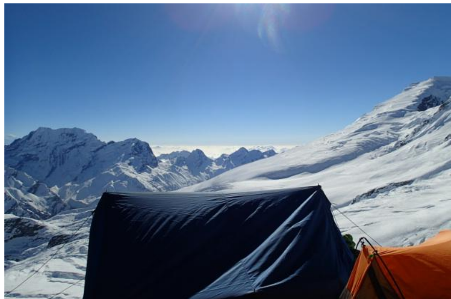
ハイキャンプからナウレク 6 3 5 8 m