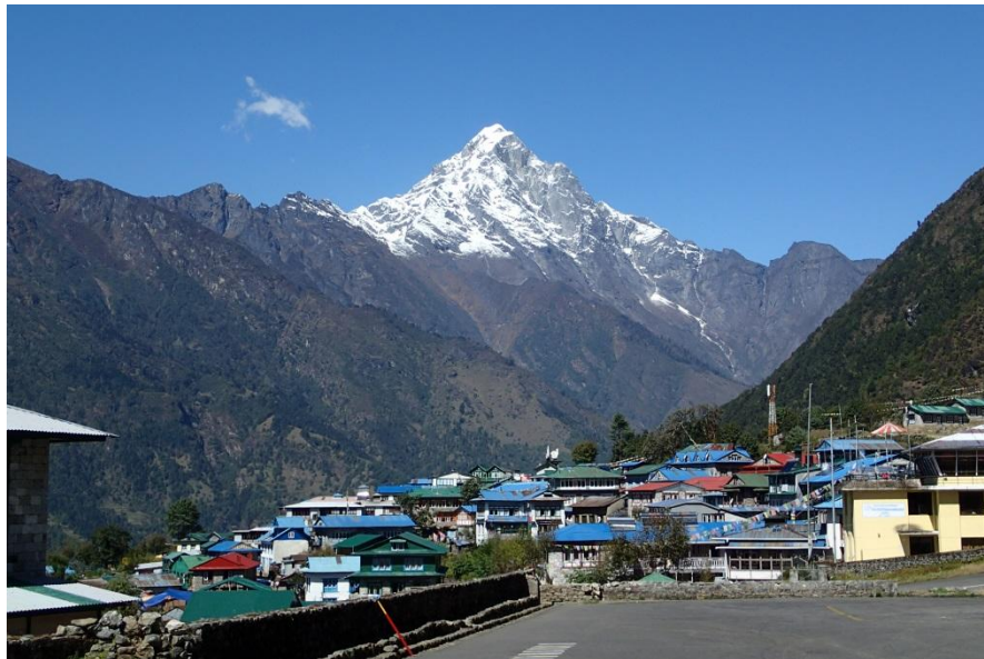
ルクラからヌプラ峰を望む