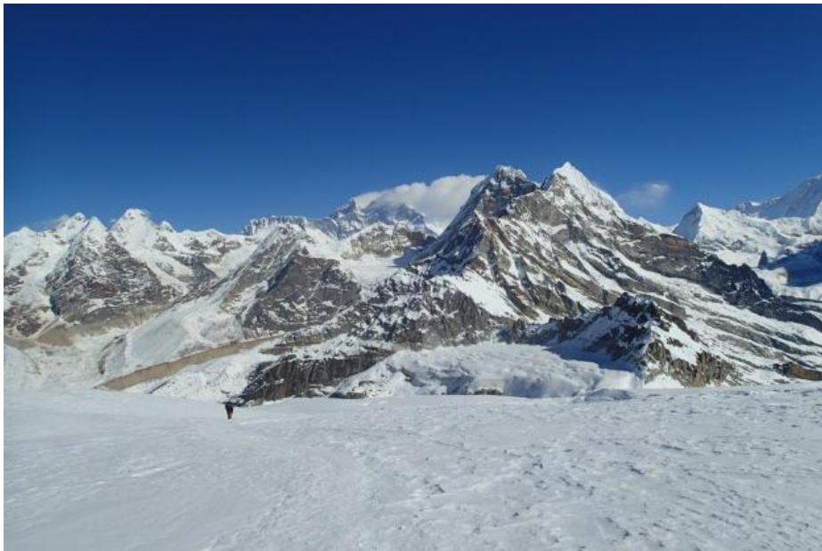
左から、プモリ、エベレスト（雪煙を上げている）、ピーク41、バルンツェ