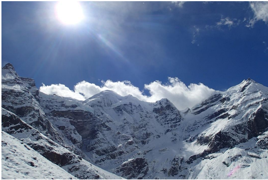
メラピーク 6 4 7 3 m