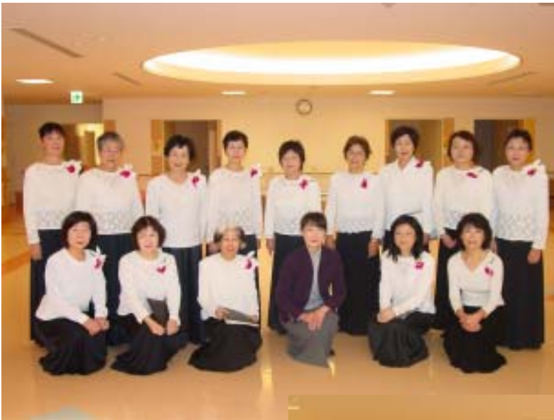
美しい歌声の 岩美コーラスの皆さん