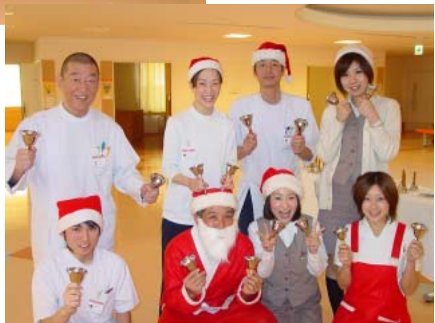
岩美病院イベント部 ハンドベル隊です