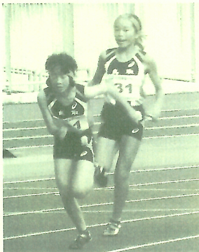
吉田さん (2走) → 清水さん (3走)