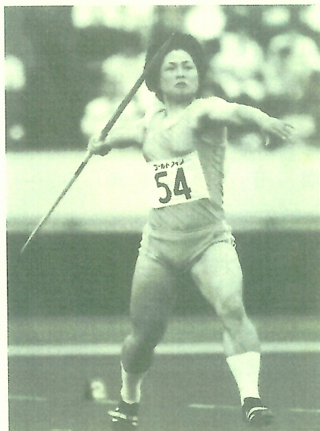
1984年ロス五輪最終選考会

確かに体力と技術と精神力が一体になった時、記録や優勝は手に入るかもしれない。でも、本当にオリンピックに行きたい（行く）という強い意志があれば、すべてをかける勇気も、条件も揃うはずです。そうすれば周囲も快くサポートしてくれます。私以上に体格や才能のある選手は山ほどいるはずです。必ず、鳥取からオリンピック選手が出るものと期待しています。